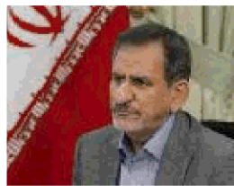
دکتر اسحاق جهانگیری (معاون اول رئیس جمهور)