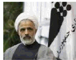
حجت الاسلام مجید انصاری (معاون پارلمانی رئیس جمهور)